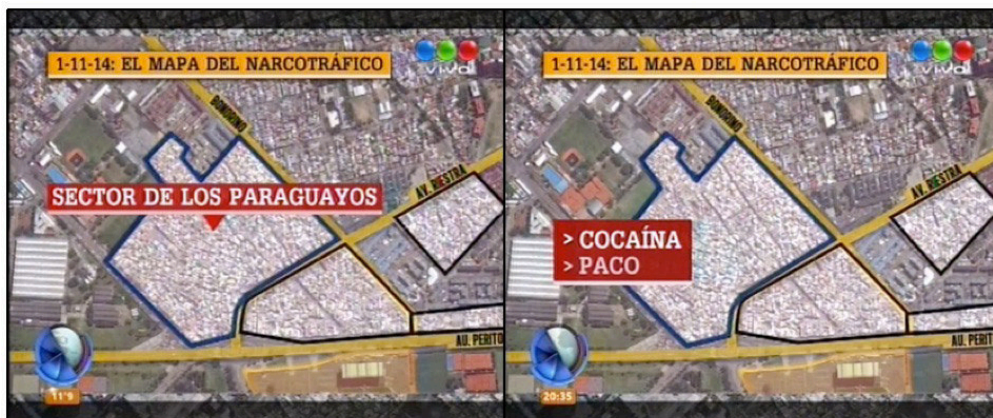
Imagen 3. Captura de pantalla Telefé Noticias Segunda Edición, 9/10/2015.

Es interesante observar, además, que el procedimiento de estadística y geo-referenciamiento raramente cuenta con fuentes. El dato y la ilustración parecen funcionar como fuentes por sí mismas y las noticias tienden a evitar dar cuenta de dónde surgen estas informaciones de las investigaciones periodísticas.