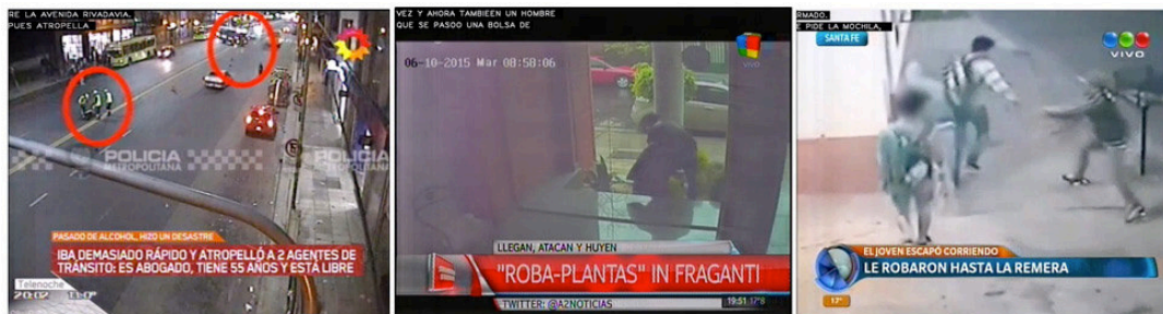
Imagen 4. Capturas de pantalla. Telenoche, 9/10/2015; América Noticias Segunda Edición, 7/10/2015; Telefé Noticias Segunda Edición, 6/10/2015.

A partir del análisis identificamos que la información producida desde estas imágenes parece ser, en general, poco relevante; alude a acontecimientos menores o con pocos datos o informantes. No obstante, los contenidos visuales generados a través de las nuevas tecnologías son colocados en un lugar central de los noticieros como resultado de la accesibilidad única al material por parte de la producción del programa. Justamente con la dramatización de la noticia surge esta tensión entre noticiar historias relevantes pero de difícil acceso o bien situaciones insignificantes pero de las que se dispone material audiovisual (Baquerín de Riccitelli, 2008). De allí a que los noticieros refuercen la figura de la primicia y la exclusividad en torno a estas imágenes. Un resultado interesante de este proceso es la dispersión de la agenda tanto al interior de cada informativo como entre las emisiones de los distintos canales. Se busca dar cuenta a los espectadores de un acceso diferencial a las imágenes como una forma de “tener la exclusiva”, más que a perseguir la relevancia noticiosa o una agenda temática preexistente.