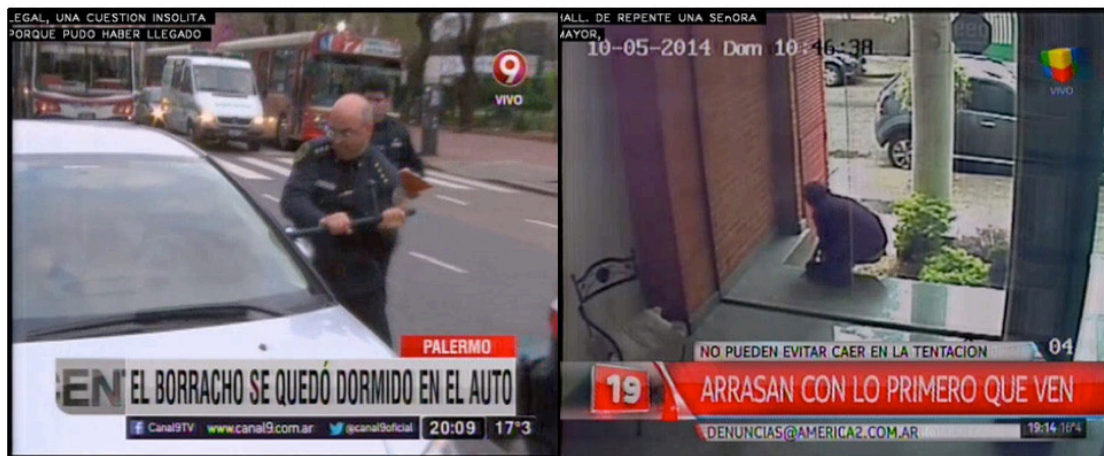
Imagen 1. Capturas de pantalla. Telenueve Central, 5/10/2015 y América Noticias Segunda Edición, 7/10/2015.

A su vez, se tematizan como “policiales e inseguridad” noticias que se asocian a otras secciones produciendo nuevamente una magnificación de lo policial a partir del encuadre criminal de noticias de información general. Se da así un marco relacionado con el delito a noticias de color, o incluso se construyen contenidos policiales a partir de acontecimientos que, en principio, no son informaciones noticiables. En consecuencia, si por un lado se magnifica lo policial al encuadrar acontecimientos como noticias sobre delitos aun cuando no lo son, por otro lado, estas “noticias policiales de color” también banalizan el delito al depreciar el acto y los actores (víctimas, victimarios y testigos).