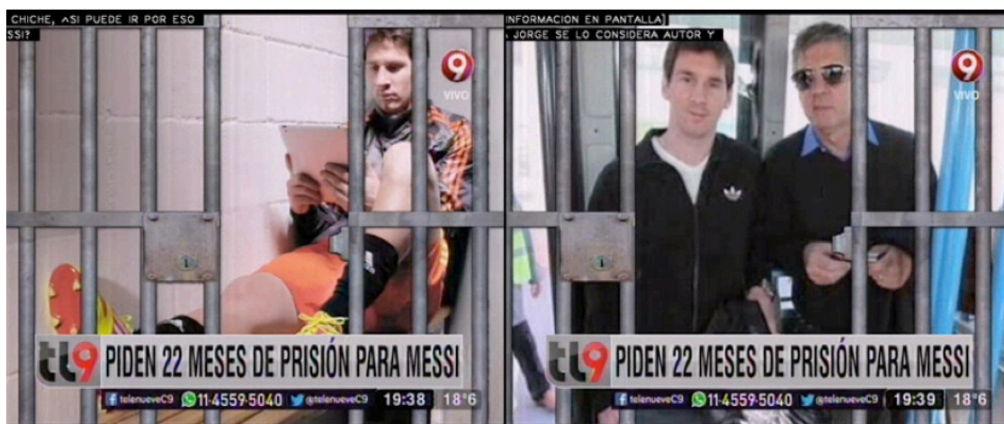
Imagen 2. Capturas de pantalla Telenueve Central, 7/10/2015.

Este procedimiento de desresponsabilización a través del encuadre se modifica cuando la noticia tiene un matiz político: en estos casos, se refuerzan las tensiones acerca de cómo se construye el victimario. Sin embargo, consideramos que los relatos sobre la “corrupción” se apartan, en principio, del modo de configuración de la noticia policial que analizamos en este artículo. Sin dudas es un eje interesante para problematizar, pero adquiere características diferentes a la definición de la noticia policial en sentido clásico, incluyendo formatos híbridos con componentes de noticias